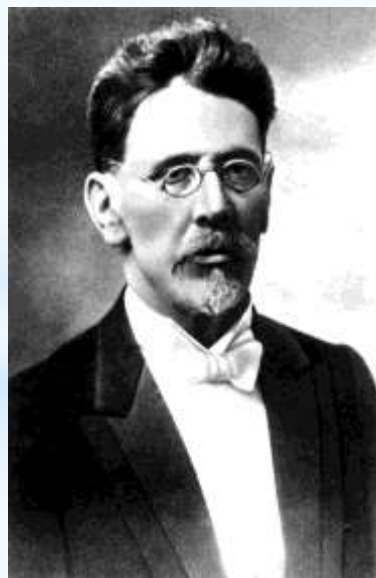
Яков Миронович Маршак отец С.Я. Маршака, заводской техник

родился 22 ноября 1887 г. в Воронежской губернии