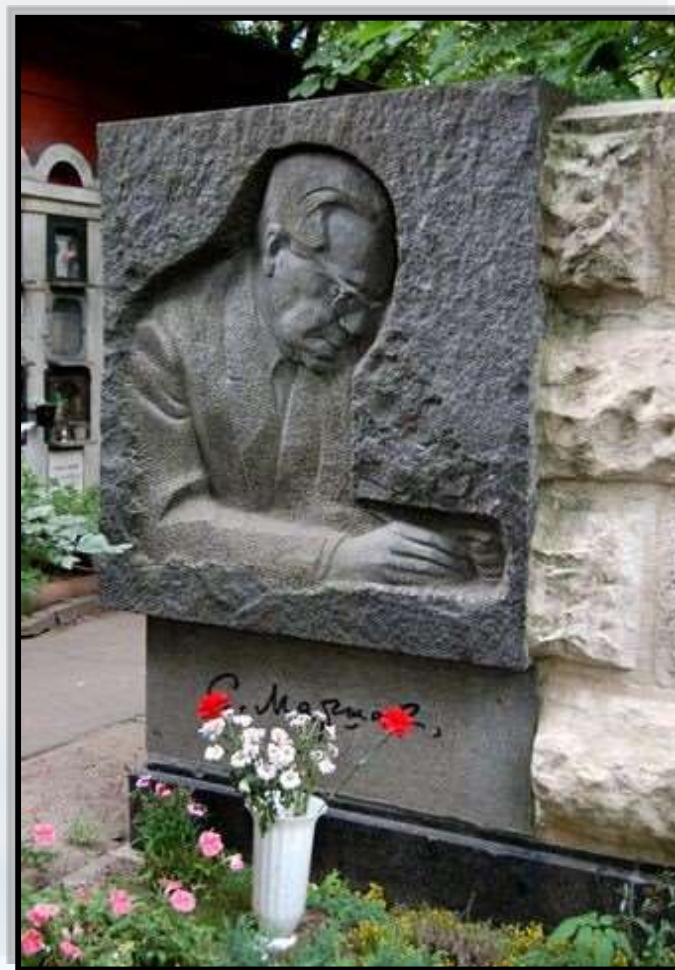
Памятник на могиле С.Я. Маршака

С. Я. Маршак скончался 4 июля 1964 года в Москве